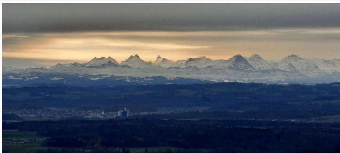
Föhnstimmung über den Berner Oberländern